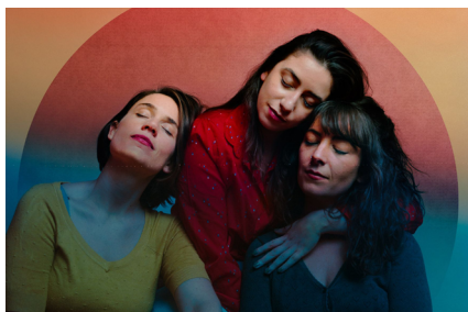
Maaar © Pierre Campistron