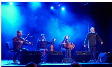
Joli Gris Jaune © Yvon Davy