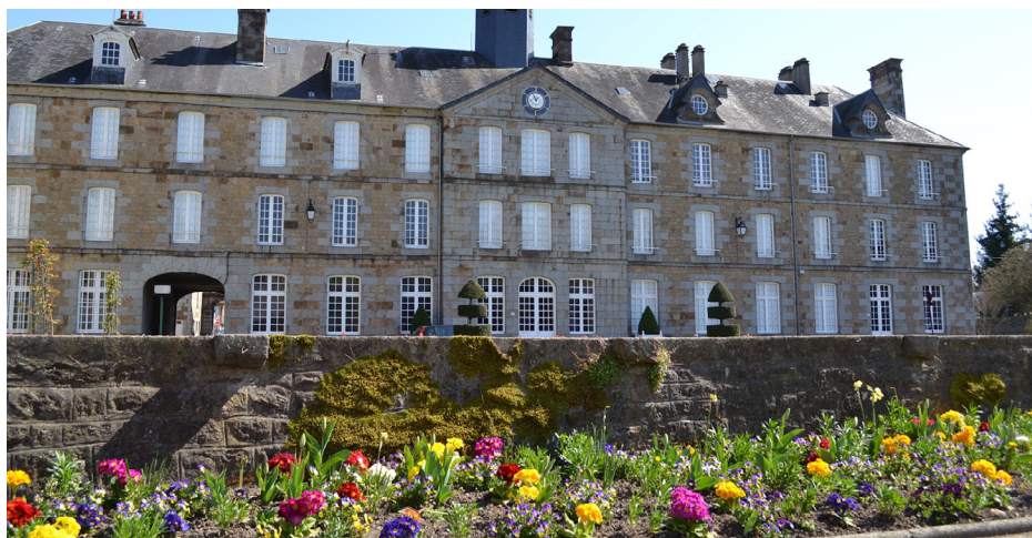
Musée de Vire Normandie