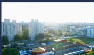
Le Point Fort 174 avenue Jean Jaurès 93300 Aubervilliers