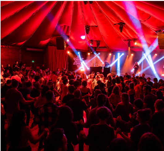
Bal électrique