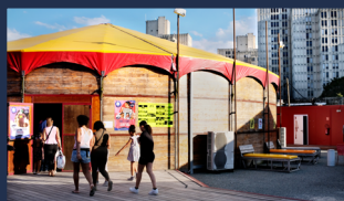
Le Chapiteau du Point Fort 174 avenue Jean Jaurès 93300 Aubervilliers